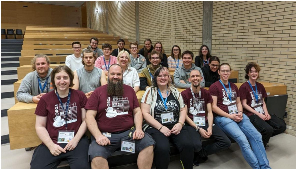
Einige der österreichischen Repräsentant:innen auf der KIF 51.5

Die KIF 51.5 hat einen großen Beitrag zur Vernetzung der deutschsprachigen, aber auch insbesondere der bisher wenig vernetzten österreichischen Informatikfachschaften beigetragen: Neben inhaltlichem Austausch während der Konferenz wurden auch weitere gemeinsame Projekte angestoßen, die weit über die Konferenz hinausgehen - sei es Unterstützung untereinander in der Planung und Abhaltung großer Events einzelner Vertretung, oder ein Austausch über aktuelle Entwicklung in den verschiedenen Studienvertretungen.