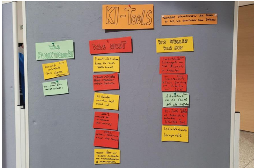
Brainstorming-Wand vor dem Arbeitskreis zu KI-Tools

Auch auf der KIF 51.5 fand eine intensive Auseinandersetzung statt, die schlussendlich auch in einer Erweiterung und Erneuerung von Forderungen der KIF 51.0 mündete.