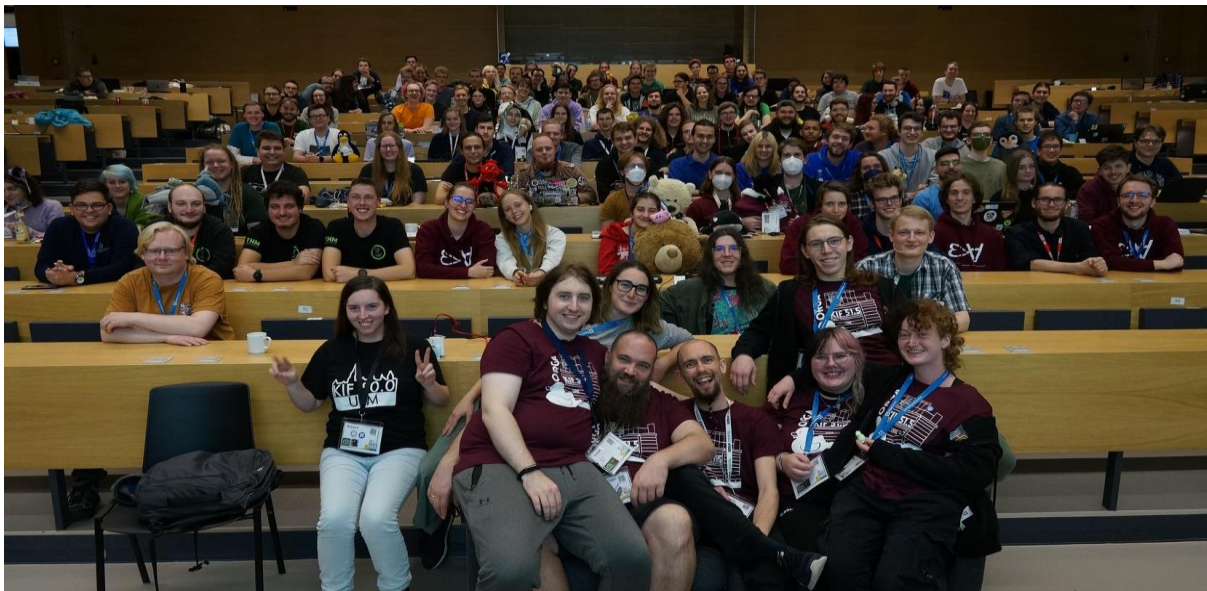
Gruppenbild im Rahmen des Anfangsplenums

Anschließend werden die im Vorfeld eingereichten Arbeitskreis-Themen vorgestellt: Basierend auf dem geäußerten Interesse wird dann nach dem Plenum ein vorläufiger Arbeitskreis-Plan für die nächsten Tage erstellt.