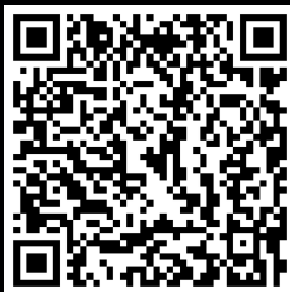
naveo App (Android)